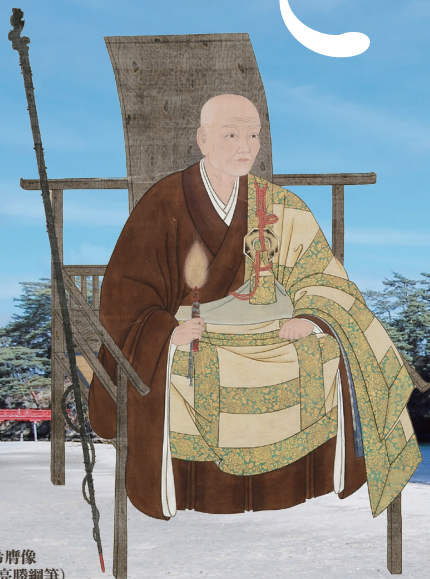
雲居希膺像 (左京克勝綱筆)